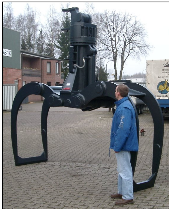
KHG30.65 mit HD Drehantrieb