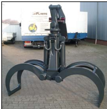
KHG15.25-630 mit SW-Adapter