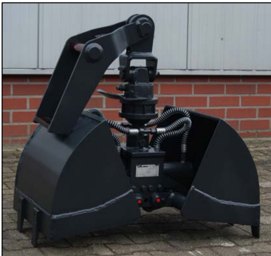
Greifer KZG1.3 mit SW-Adapter.